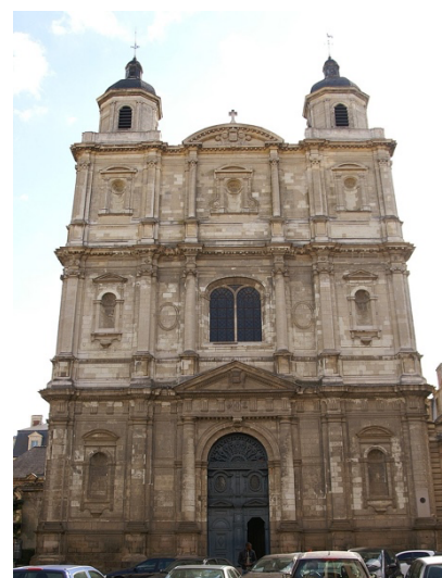
église des Jésuites à Rennes