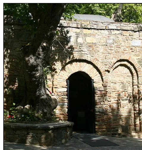
Maison de Marie à Ephèse